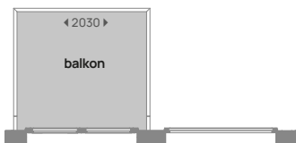
Afwijkende gevel Willem Parelstraat 213, 217, 237, 241, 261, 265, 277 & 281

Open woonruimte met keuken, slaapgedeelte en toegang tot gezamenlijke buitenruimte • Witte Bribus keuken in rechte opstelling, voorzien van donker aanrechtblad met inductiekookplaat en afzuigkap • Badkamer voorzien van douche met glazen douchedeur, wastafel en toilet • Bergkast met opstelplaats voor wasmachine en droger • Berging met WTW • Vloerverwarming • Schuifpui of openslaande deuren met toegang tot gezamenlijke buitenruimte • Willem Parelstraat 213, 217, 237, 241, 261, 265, 277 en 281 hebben een eigen balkon op het noordoosten